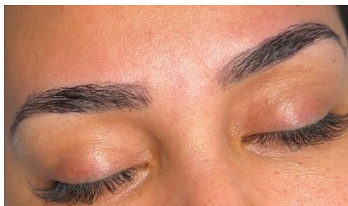
Das war nach der "Brow Lift Reanimation" Je nach Grad der Verbrennung, kann man es nicht zu 100% rückgängig machen. Aber alles wird besser sein, als vorher.

Nun erkläre ich euch auf der nächsten Seite, wie wir Schritt für Schritt das verbrannte Lifting rückgängig machen.