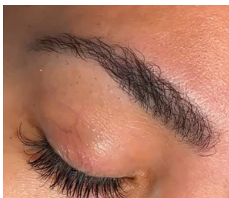
Diese Kundin kam mit einem verbranntem Lifting aus einem Fremdstudio zu mir.